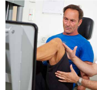
Unser Ziel ist es die Mobilität unserer Patientinnen und Patienten wieder herzustellen.