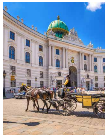
Wien mit seinen historischen Sehenswürdigkeiten ist immer einen Ausflug wert.